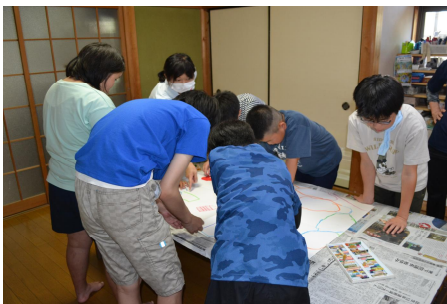
絵画…那岐山から見た奈義の町