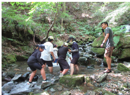
川遊び…屋敷の滝で気持ち良く