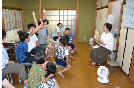
読み聞かせ…「この本知ってる？」