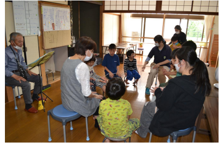
歌・リズム遊び…隣の人と手拍子