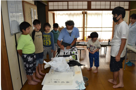
習字…先生の筆使いを見る

今年の夏は、一段と厳しい暑さが続いています。夏休み中、子どもたちは元気に来塾し、体づくりや学習に取り組んでいます。エンジョイタイムでは、地域のボランティアのみなさんにお世話になり、いろいろな体験をすることができています。ボランティアの皆さん、本当にありがとうございます。