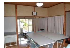
袋詰め・組立・出荷