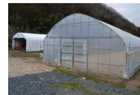
ビニールハウス(水耕栽培)