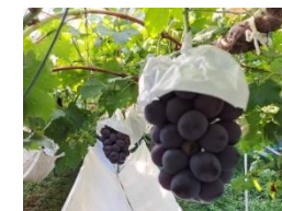
ブドウ栽培(減農薬)