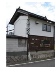
調理・接客・販売・展示