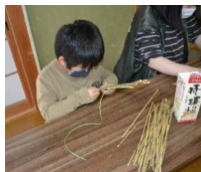
匠の技「かや細工」に挑戦