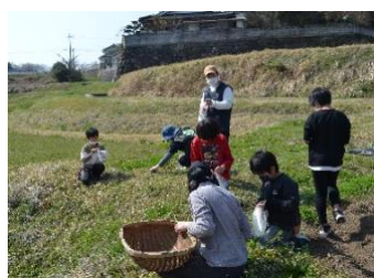
春の味覚「よもぎ団子」作り