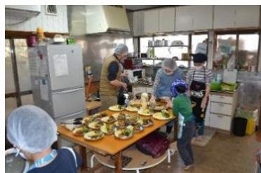
できあがり楽しみ「お昼ご飯作り」