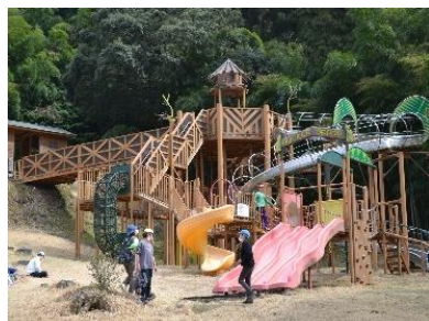
トム・ソーヤ冒険の村で鬼ごっこ