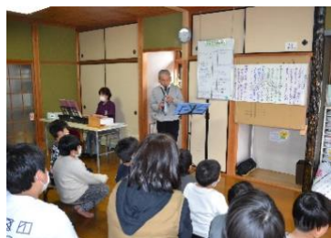
楽しく元気に「音楽・リズム遊び」