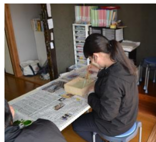
自由に描こう「油絵」「けずり絵」